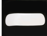
● 帯板 1枚