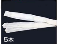
5本 ● 腰紐 5本