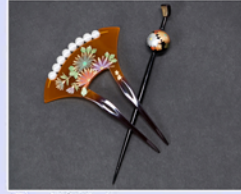
● 髪飾り (ご希望の方)