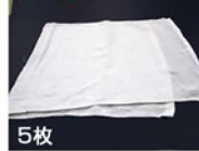
5枚 ● タオル 5枚