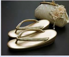
● ぞうり・バック (バックは撮影時に使用しておりません 外出で必要な方はお持ちください)