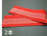
2本 ● 伊達締め 2本