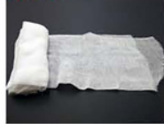
● ガーゼ3m程度 または和装ブラ (ガーゼは体型に よっては使用しない 場合もございます。 和装ブラの販売は していません)

足りないものは販売やリースが ございますので、お気軽にお申し付け下さい。 * 外出の際は販売のみとなります。