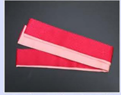
● 伊達襟・重ね襟 (お着物によってついている 場合がございます)